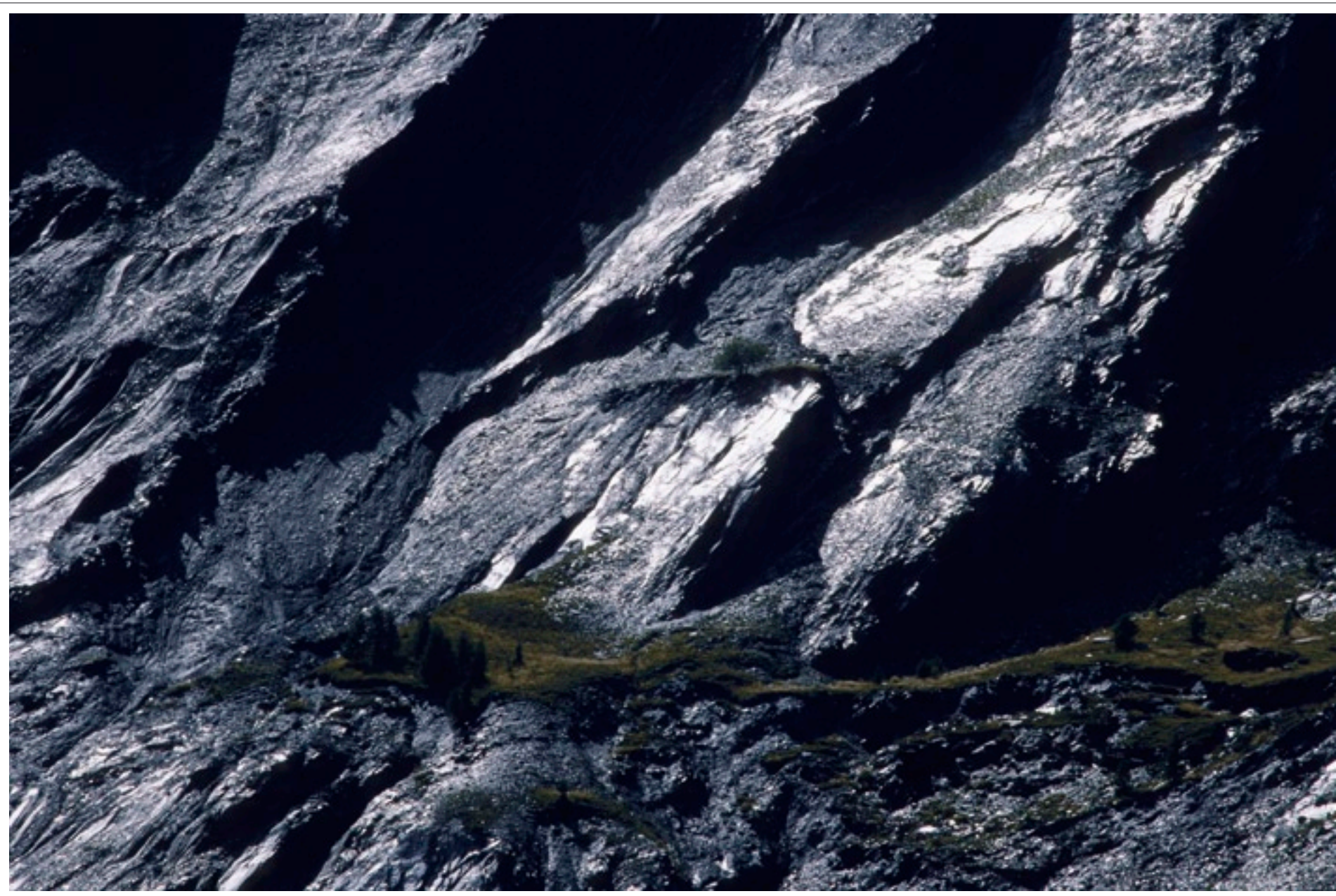
Conifères sur un replat Alpes