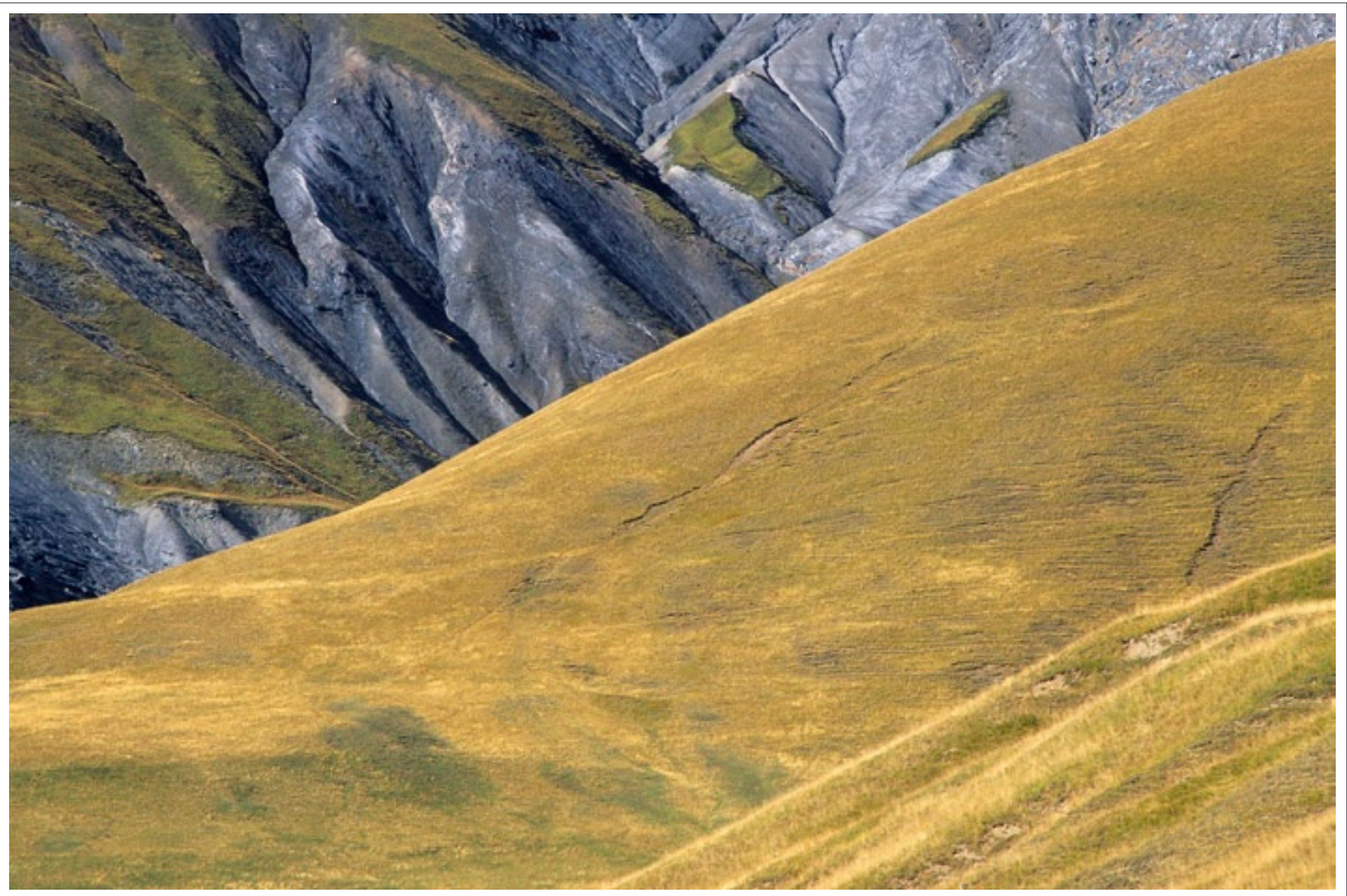
Colline dorée Alpes