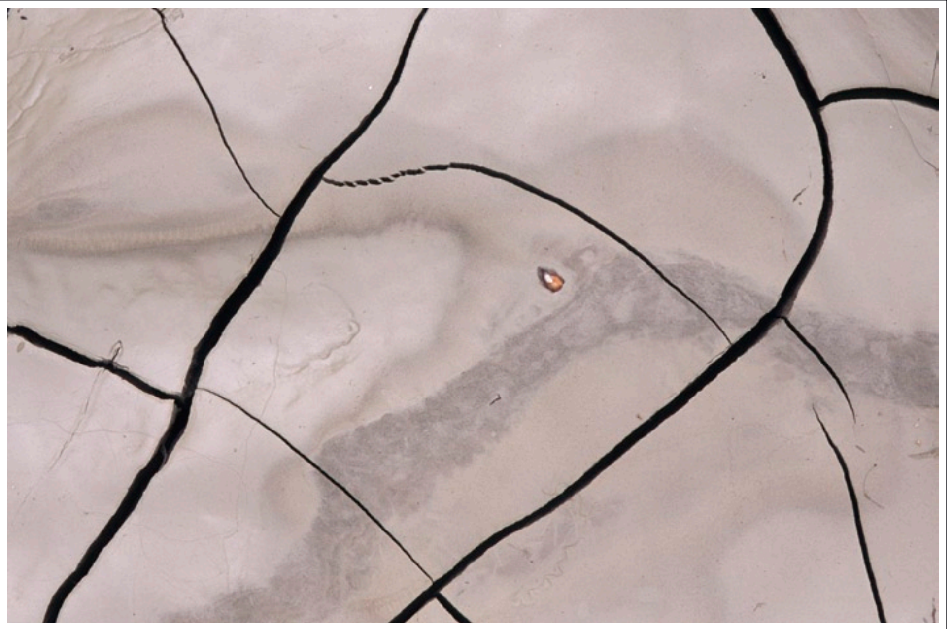
Argile en dessiccation Provence